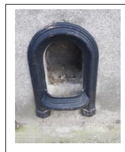
Voorbeeld van een voetschraper